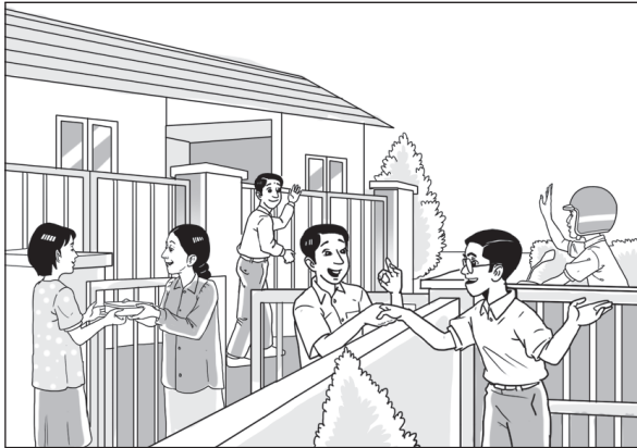
Menjalin Hubungan Baik dan Memuliakan Jiran