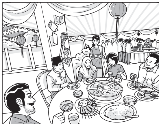
Mengadakan Majlis Rumah Terbuka 1Malaysia