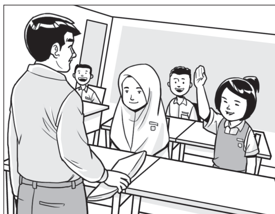
Belajar di Bawah Satu Bumbung