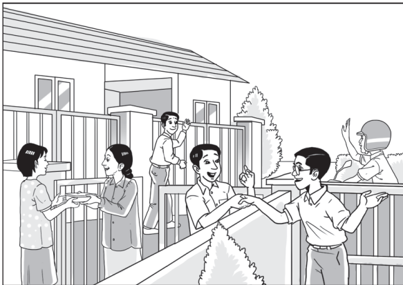
Menjalin Hubungan Baik dan Memuliakan Jiran