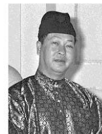
Sultan Hisamuddin Alam Shah

Cadangan tersebut dikemukakan semasa ____.