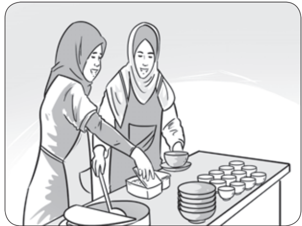
Pekerja Berpakaian Kemas