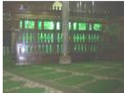
* Makam Imam As-Syafie

Muhammad bin Idris As-Syafie yang juga dikenal sebagai Imam As-Syafie adalah ahli fikah Islam yang terkemuka dalam sejarah Islam. Beliau adalah pengasas kepada Mazhab As-Syafie, salah satu daripada mazhab Islam yang banyak diikuti oleh penganut agama Islam di India, Indonesia, dan Malaysia.