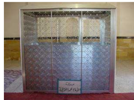
* Makam Al-Ghazali di Baghdad