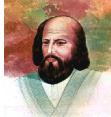
* Imam Al-Ghazali

Abu Hamad Muhammad bin Muhammad bin Ahmad Al-Ghazali At-Tusi dilahirkan pada tahun 1058M di Tus, Khurasan adalah seorang filsuf dan teologi Muslim Persia (Iran) yang dikenal sebagai Algazel di dunia Barat pada abad pertengahan.