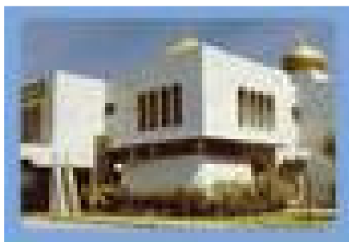
* Mahkamah Syariah Sabah