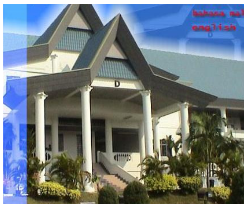
* Mahkamah Syariah Negeri Melaka