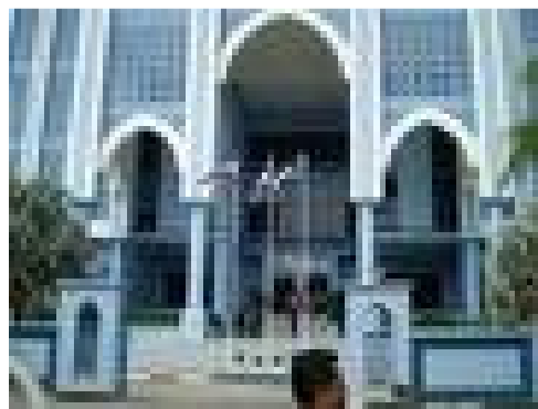
* Mahkamah Syariah Terengganu