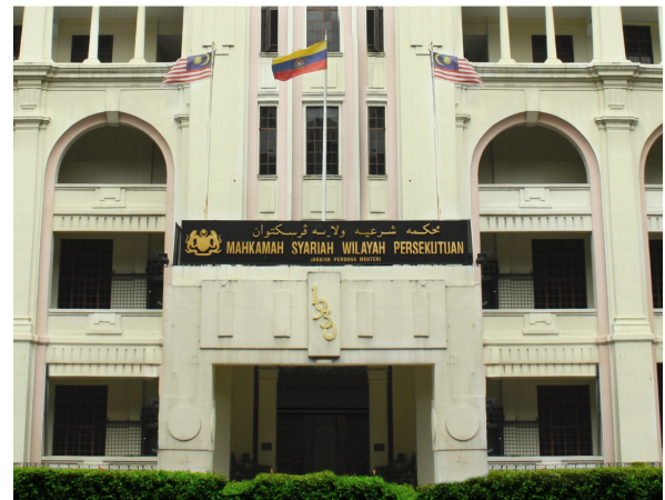
* Mahkamah Syariah Wilayah Persekutuan

Institusi kehakiman yang membicarakan perkara-perkara Mal dan Jenayah yang melibatkan orang-orang Islam mengikut bidang kuasa