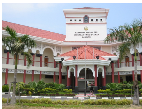
* Mahkamah Rendah & Mahkamah Tinggi Syariah Manjung