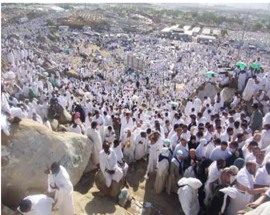
* Wukuf di Arafah

Ketika wukuf, terdapat beberapa peristiwa penting yang boleh dijadikan pegangan dan panduan umat Islam . Antaranya termasuklah: