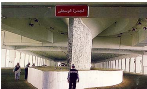
Rajah (2) – Jamrah Al-Wusta