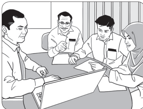
Perpaduan Semakin Kukuh